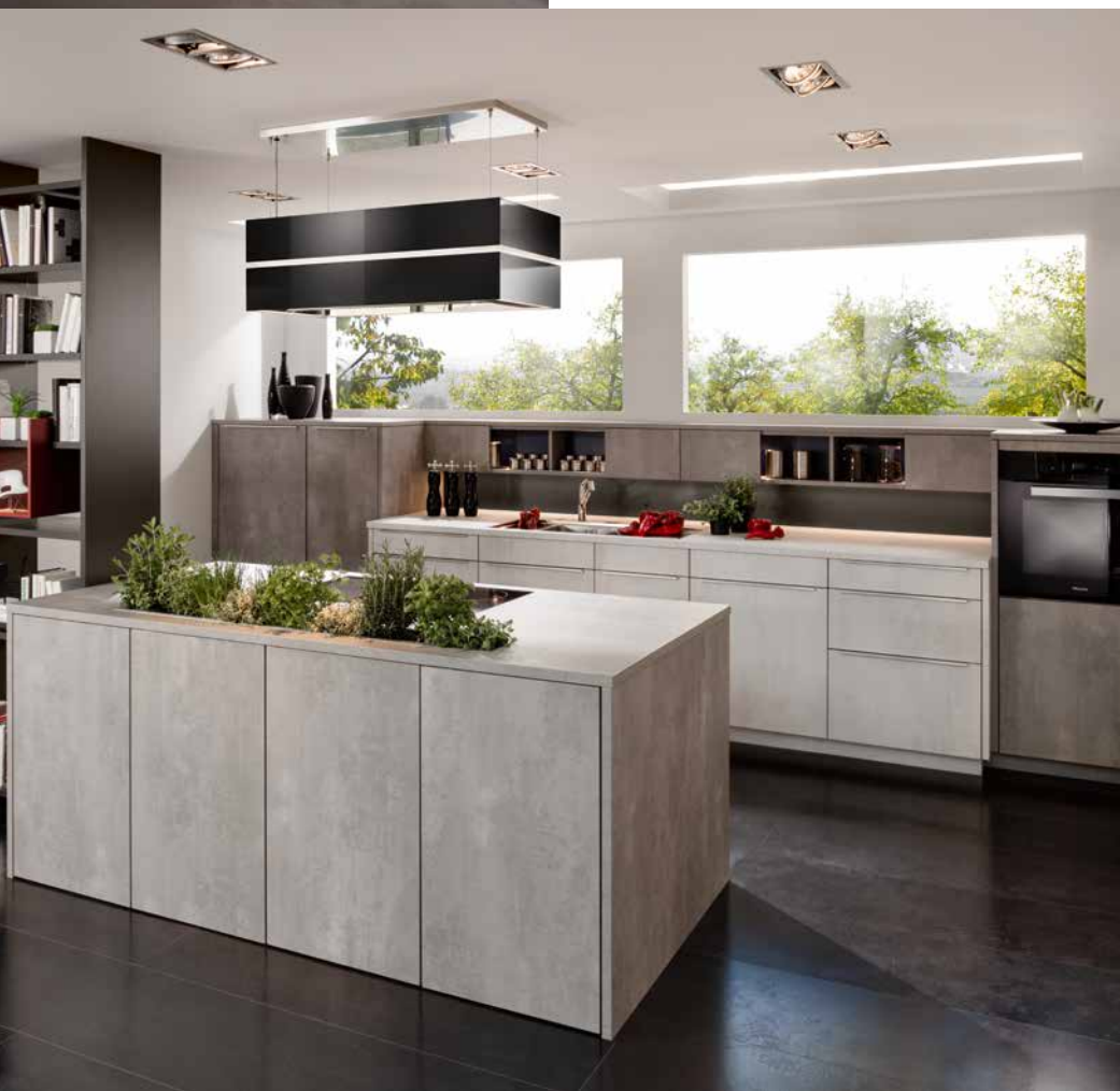
pietra grey (PY) *